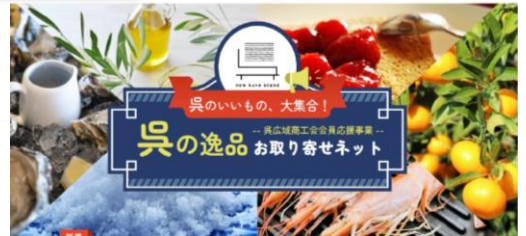
【呉の逸品お取り寄せネット】 (ECサイト展開)