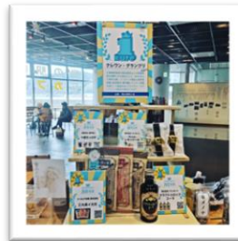
【地元観光施設での売場の 展開・拡大】

自慢の逸品をエントリーいただき、年間最優秀商品を決めます。「ひろしま夢ぶらざ」「銀座TAU」でのテストマーケティングなどによりグランプリを決定し、販路の拡大に繋げていきます。