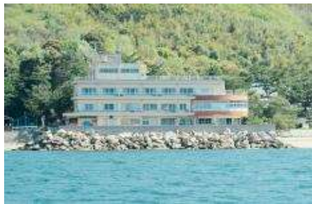
シーサイド桂ヶ浜荘