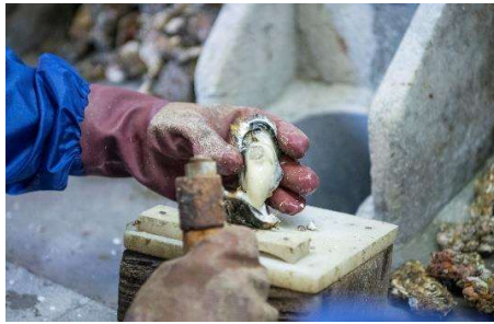
牡蠣打ち体験 (イメージ)